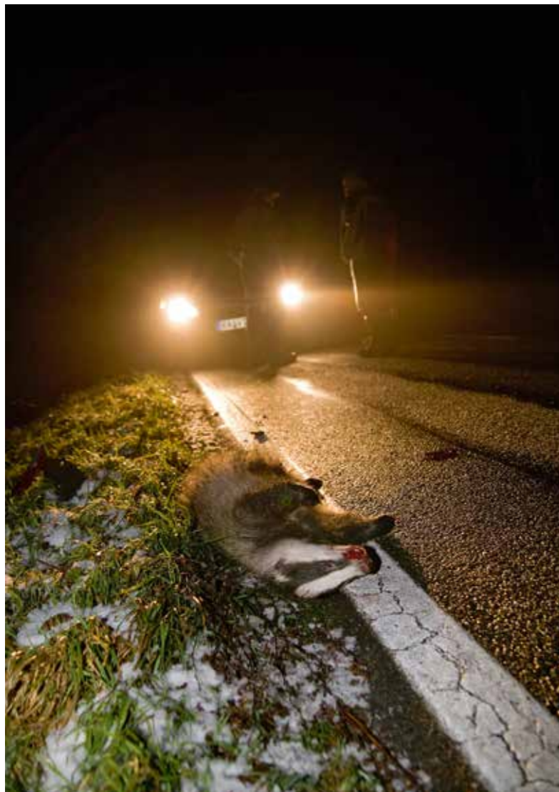
Fangschüsse auf der Strasse sind wegen Personen- und Sachschäden sehr heikel.